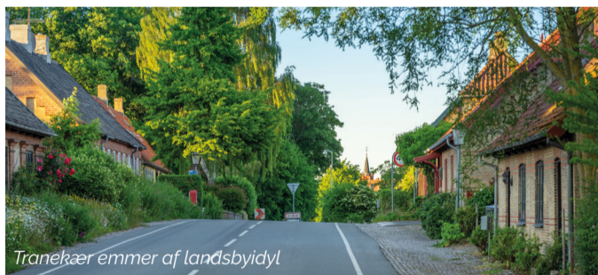
Tranekær emmer af landsbyidyl

Det store fugtige engområde, Flådet syd for Tranekær, var for 9.000 år siden en stor lavvandet sø. På holme og næs havde jægerne sommerbopladser og med våben fremstillet af sten træ og ben jagede de rådyr, krondyr, vildsvin og muligvis også elge. I søen fiskede de gedder og i de arkæologiske fund afsløres også små pattedyr og fugle blandt byttet. Knogler fra hunde tyder på brug af jagthunde. I dag kan du opleve vilde heste på Flådet, ligesom ved Gulstav på Sydlangeland. Exmoor-ponyer står for naturplejen, når de afgræsser området. På visse tidspunkter af året kan Flådet være vådt og kræve ekstra gode støvler. Der henvises på stedet til en alternativ rute igennem Tranekær by.