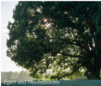
Egen ved Hesselbanke