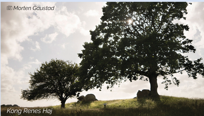
Kong Renes Høj