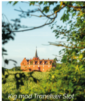
Kig mod Tranekær Slot