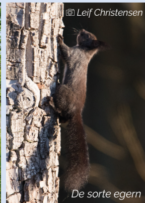
De sorte egern