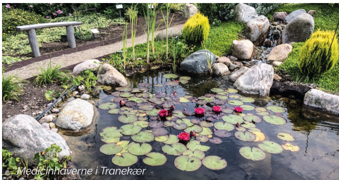
Medicinhaverne i Tranekær