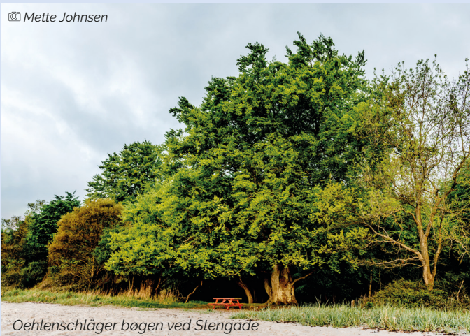
Oehlenschläger bogen ved Stengade

Øhavsstien fra Lohals over Tranekær til Stengade Strand – ca. 29 km Stien begynder i Lohals og er de første mange kilometer præget af havet og stranden ned langs Langelands vestkyst med smukke havkig fra toppen af høje kystklinter. Fra Kohave løber stien tværs over øen gennem Tranekær By til Langelands mere flade østkyst med den smukke Stengade Strand. Folderen beskriver med udgangspunkt i Lohals nogle af de seværdige oplevelser undervejs.