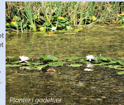
Planter i gadekær

Langeland har ca. 50 gadekær. Gadekær er oprindelig betegnelse for et kær (et naturligt eller gravet vandhul) i landsbyens fælles gadejord. Gadekær har, ud over naturmæssige og kulturhistoriske værdier, ofte også en stor rekreativ betydning og har fungeret som samlingssted for landsbyen. Næsten alle landsbyerne på Langeland har, eller har haft, et eller flere gadekær. Ofte er gadekæret – eller "byens vanding" – landsbyens ældste anlæg og udgangspunkt for byens placering i landskabet fordi gadekærene blev anlagt, hvor der var trykvand eller kilder, der kunne tilføre rent og friskt vand hele året. Gadekæret var stedet for mange aktiviteter og byens branddam.